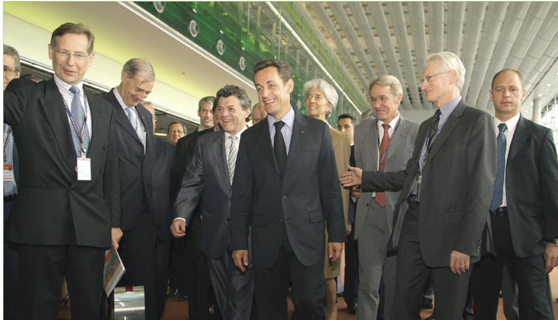
26 juin 2007 : inauguration du satellite n°3 de l'aéroport Roissy-CDG par le Président de la République, Monsieur Nicolas SARKOZY. Le Président de la République a validé la plupart des projets de Yanick Paternotte, favorables à une stratégie de développement durable de l'aéroport.

Présentation de EUROCAREX au congrès de l'Association Française pour la Logistique (ASLOG) à Paris.