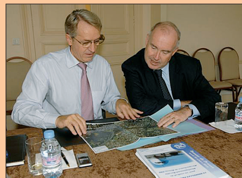
Ministère des Transports : Yanick PATERNOTTE présente le projet Carex à Dominique BUSSEREAU, Secrétaire d'État.